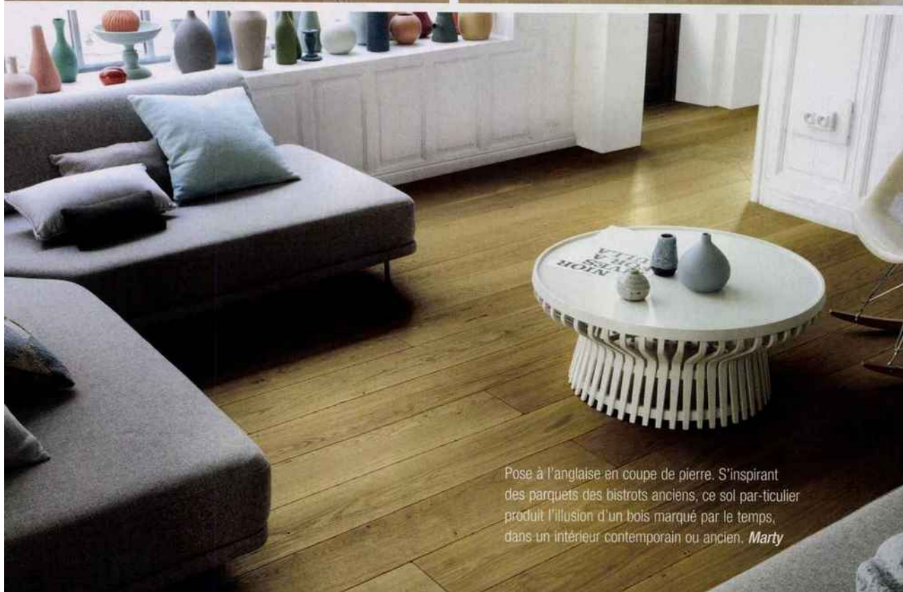
Pose à l'anglaise en coupe de pierre. S'inspirant des parquets des bistros anciens, ce sol particulier produit l'illusion d'un bois marqué par le temps, dans un intérieur contemporain ou ancien. Marty