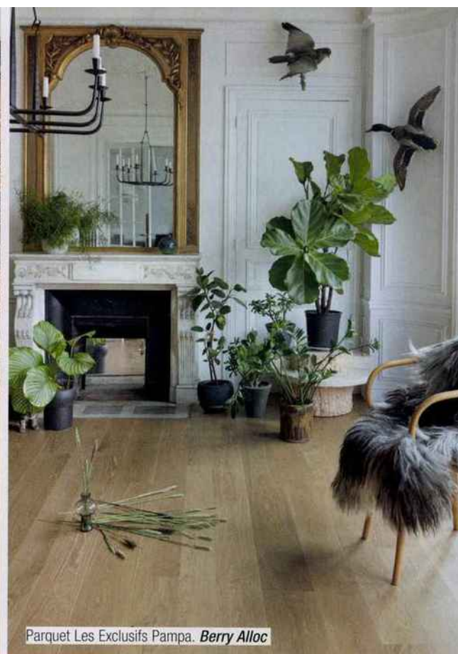
Parquet Les Exclusifs Pampa, Berry Alloc